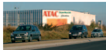
Donner à l'Ouest biterrois une zone commerciale

Cantegals, lancée il y a six ans sur la commune de Colombiers, affirme son ambition commerciale, particulièrement depuis l'ouverture en 2005 de l'hypermarché ATAC. Cette spécialisation est appuyée par la CCI, qui, dans son schéma de développement commercial, préconise un rééquilibrage des implan-