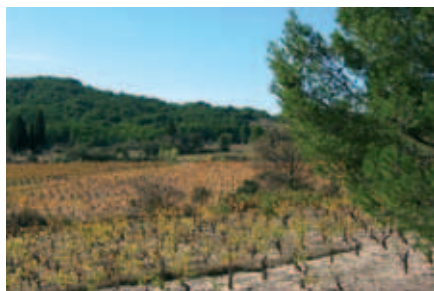
Plusieurs domaines en AOC "coteaux du Languedoc"

2006 verra pour Via Europa la poursuite de sa commercialisation, et pour la Domitienne, l'engagement de nouveaux axes de développement par l'économique, tels que les dispositifs d'accueil de jeunes entreprises et d'investisseurs, ou encore la création de parc d'activités économiques à vocation communale.