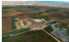
L'ambitieuse Via Europa

Nouvelle filiale des Autoroutes du Sud de la France, Truck Etap proposera aux quelques 1000 camions qui traversent chaque jour le tronçon Béziers-Narbonne une aire avec parking de 350 places et une zone de services sur un total de 9 ha. Outre les 40 emplois envisagés initialement, le projet pourrait entraîner l'implantation d'un hôtel ou d'entreprises de transport et de logistique, cœur de cible de via Europa. Le début des travaux est prévu pour la fin de l'année.